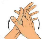
3. Paume contre paume, doigts entrelacés

Les 7 étapes de la friction des mains avec une solution hydro-alcoolique