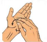
6. Bouts des doigts dans la paume opposée